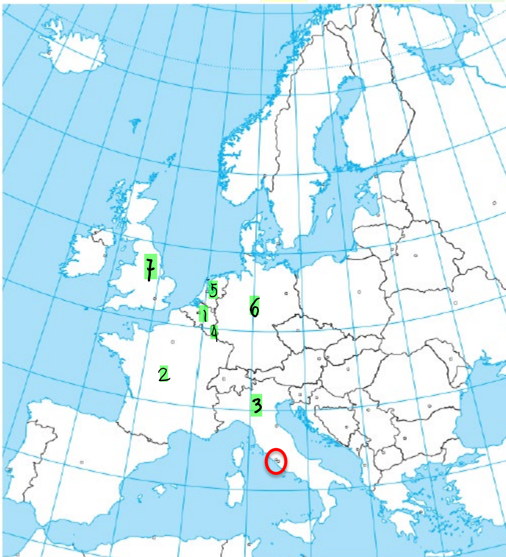
Mapa A.