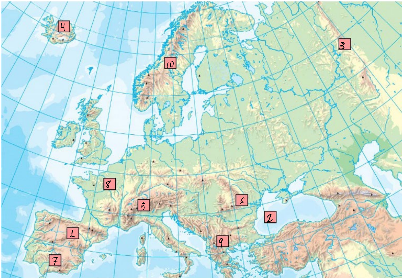
Mapa mudo A.

1. Lea el texto y responda a las preguntas (1 punto; 0,20 puntos por cada respuesta correcta)